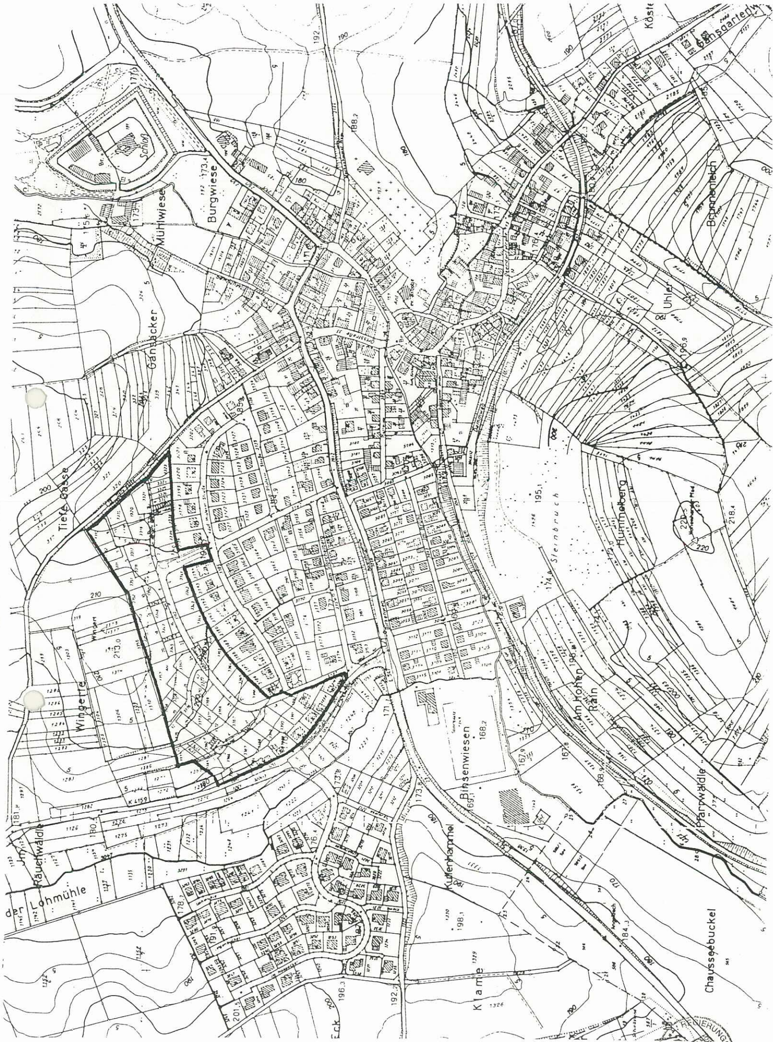
Satzung der Stadt Wiesloch über die Zahl der notwendigen Stellplätze für Wohnungen